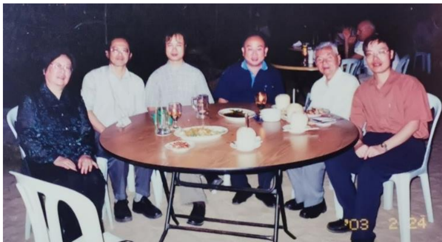
蒋华良院士（左三）与嵇汝运院士（右二）、李晓玉教授（左一）、新加坡理工学院姚建平副校长（右三）、潘春木博士（左二）在新加坡东海岸海边

2003年2月底，你陪同我们的导师和师母应邀访问新加坡理工学院，那是我印象中你出差安排得最为轻松的一次旅程。你陪同老师做学术报告、到植物园故地重游、与老朋友们相聚、与当地媒体互动。